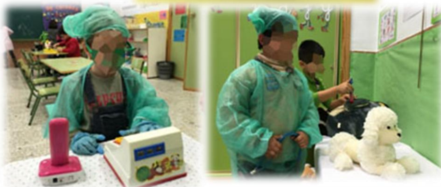
Rincón del proyecto